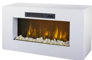
Méribel Réf 121