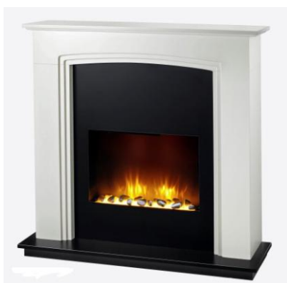
HAMPTON Réf 123