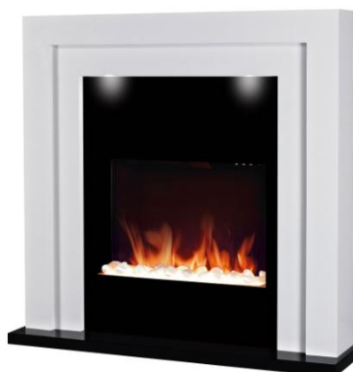
Manhattan Réf 088