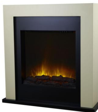
Avoriaz Réf 102